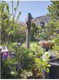
Garten á la Karl Neue Reihe in Wulferstedt

17.05. | 21.06. | 19.07. (mit Vortrag 13 Uhr) 16.08. | 06.12.2026 11:00 - 16:00 Uhr