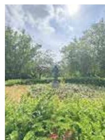
Bilder: L. Hinz